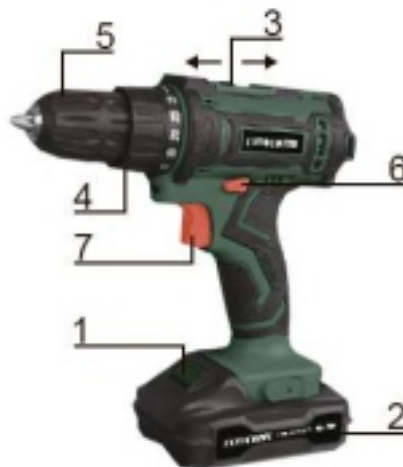
Мод. DC 1802 PROMO Рис. 3