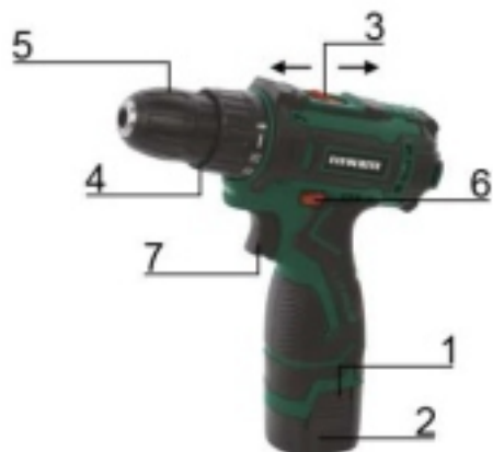
Мод. DC 1202 PROMO Рис. 2